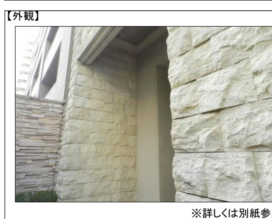
※詳しくは別紙参照