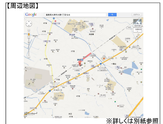
※詳しくは別紙参照