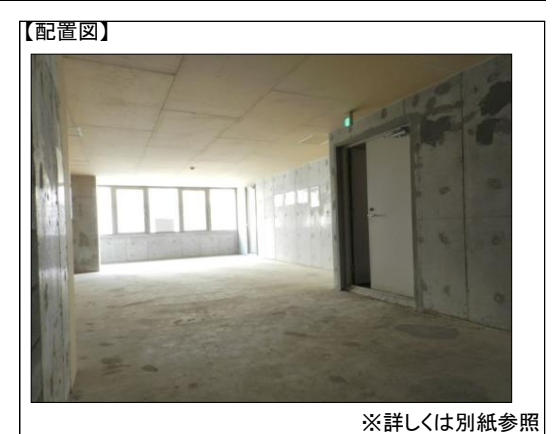
※詳しくは別紙参照